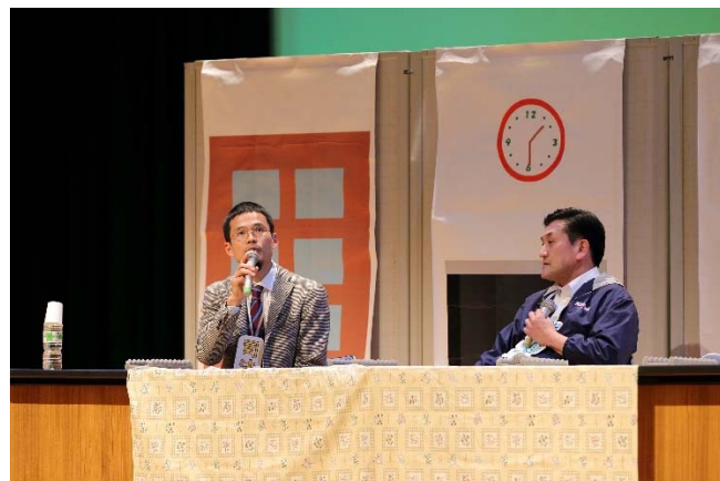
「成年後見制度」寸劇

札幌司法書士会では、司法過疎地における法律相談事業などを通じ、司法アクセスの改善に積極的に取り組んでおります。